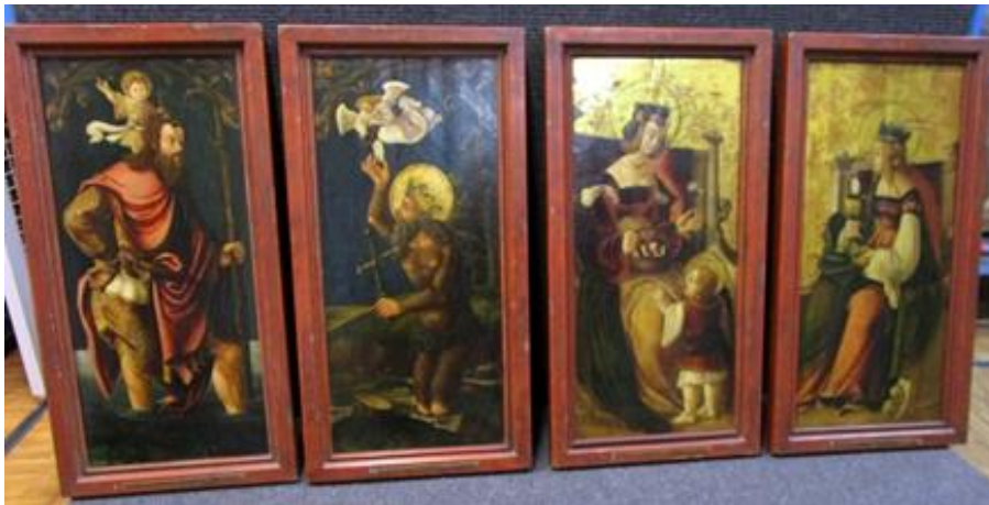
Die Altarbilder des 14-Nothelferaltars der St. Nikolauskirche