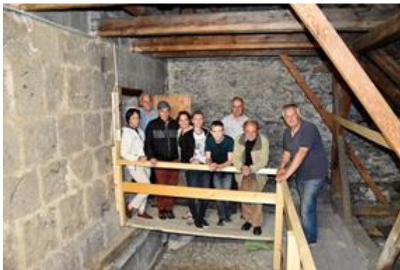
Die Turmbesteiger am Kranzlabend

Im Rahmen einer Kirchturmführung am vergangenen Kranzlabend um 19:00 Uhr - also dem Vorabend zu Fronleichnam - wurde es einigen unserer Vereinsmitglieder ermöglicht, beim „Betläuten“ mit der „Großen Glocke“ am Kirchturm mit dabei zu sein. Schon der Aufstieg, vorbei an der alten Turmuhr hinauf zur Glockenstube, war sehr spannend. Ein richtiges und vor allem respekt einflößendes Abenteuer war dann das Glockenläuten mit der 2.636 Kilogramm schweren Herz-Jesu-Glocke. Drei Gesätzchen mit der Glocke, dazwischen immer wieder ein Böllersalut vom Klauzbühel, und dann mit der so genannten Bauernglocke ein weiteres Gesätzchen, dem dann mehrere Böllerschüsse folgten. Unmittelbar danach konnte man auf dem 700 Jahre alten Turm, den einzigartigen Klängen unserer Musikkapelle lauschen, die traditionsgemäß mit ihrem Zapfenstreich den bevorstehenden Festtag begrüßt. Ein Erlebnis mit bleibender Erinnerung.