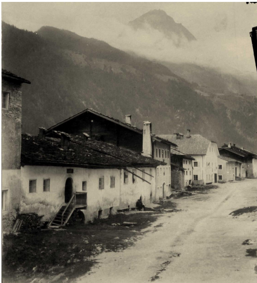
Der Matreier Hintermarkt vor dem großen Brand vom 10. Mai 1897. Es dürfte sich hier um eine der ältesten bekannten Aufnahmen des Hintermarktes handeln.

Die Häuser der Reihe nach von links nach rechts sind: Planker-Bräu, Linder (steht nicht mehr), Treindler, Schuster, Gaber (steht nicht mehr), Gaber Seppelis (steht nicht mehr), Schneider (vormals Bergrichter-Haus), Henner (vormals Rasen), Santner (steht nicht mehr), Uhrmacher (steht nicht mehr) und Bäcken.