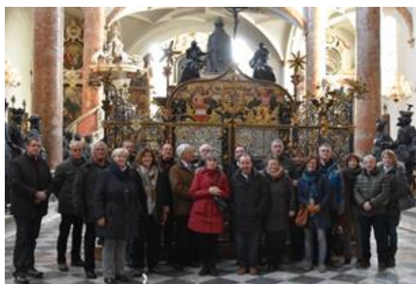
Die Ausflugsteilnehmer in der Innsbrucker Hofkirche