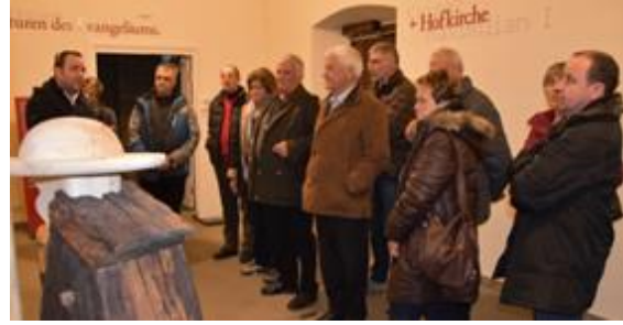
Aufmerksame Zuhörer im Volkskunstmuseum.