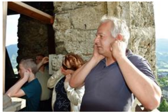
Gut beraten ist, wer seine Ohren schützt