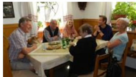
Gesellige Runde in der Kössler-Bauernstube